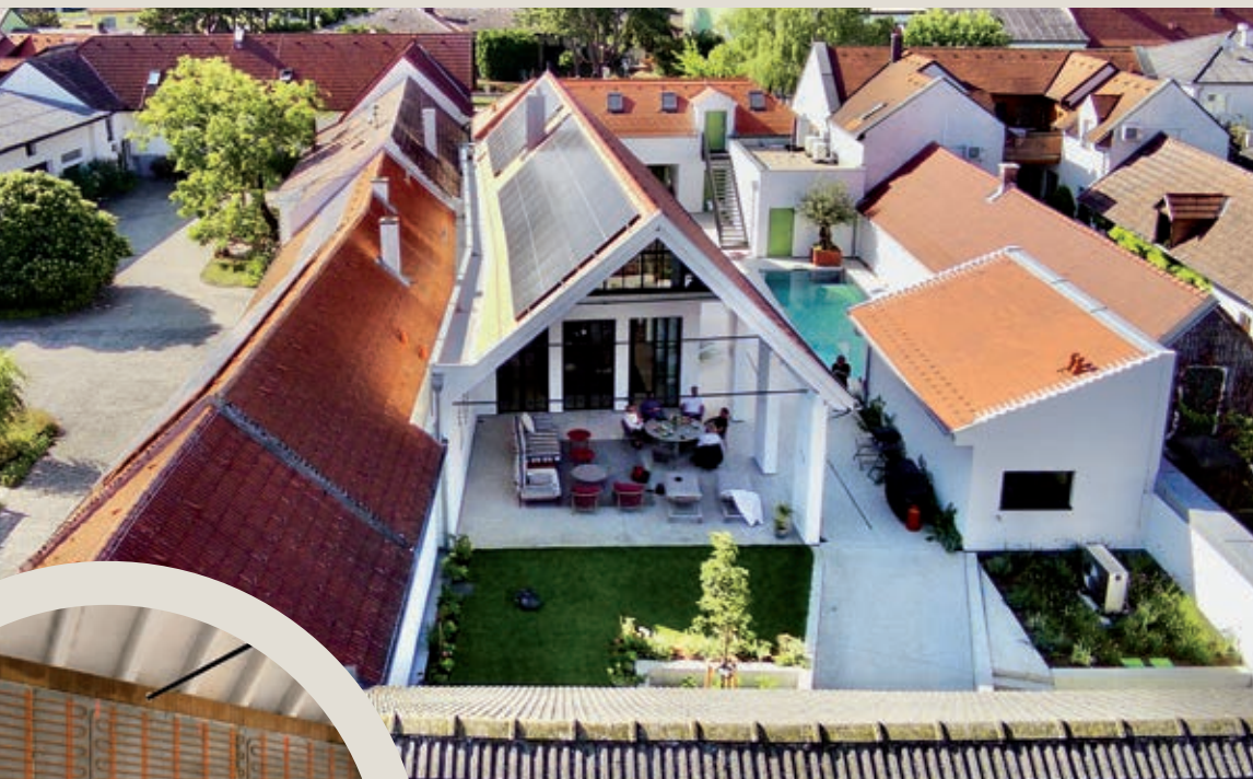
Eine Photovoltaikanlage am Dach liefert 16 kWp Leistung. Die überdachte Terrasse wird das ganze Jahr genutzt. Über 70 m 2 Wandheizungen/-Kühlungen wurden aktiviert und wie in alter Römerzeit mit Kalkputz verputzt.

Gerhard: Die meisten Häuser in dieser Straße waren alte Streckhöfe in L-Form. Schmal und lang. Der Grund