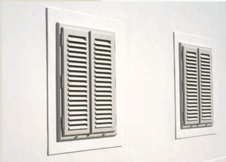
Wunderschöne Türen und Klappläden, passend zur Fassade.