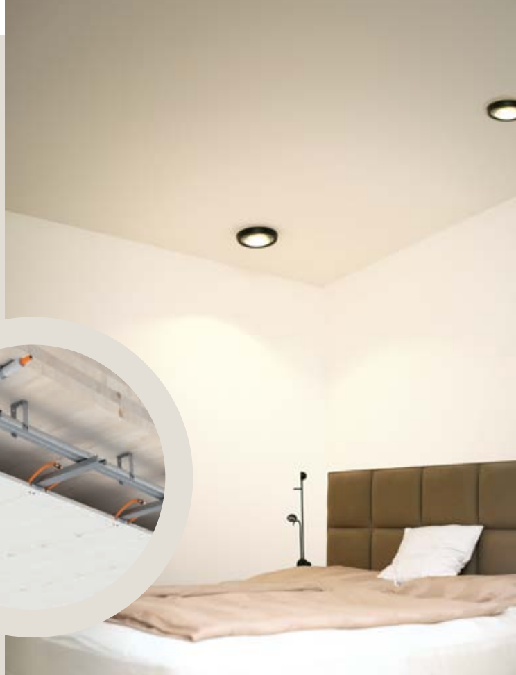
Im Schlafzimmer wurde eine Deckenkühlung/Heizung im Trockenbau eingebaut.